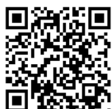
ぐんま昆虫の森 公式HP