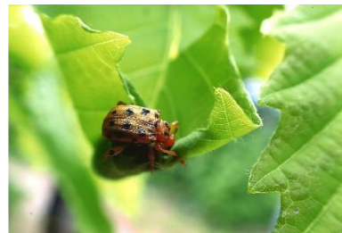
キッズ部門 最優秀賞 「建築」