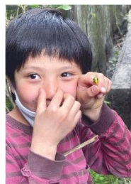
自由部門 最優秀賞 「クサイけど、カッコイイ!!」