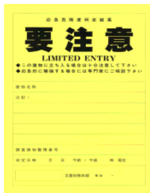
(黄色) この建物に立ち入る場合は十分注意して