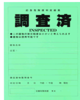
(緑色) この建物は使用可能です