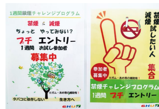
「禁煙サポートプログラム」は、参加者の意思や状況に合わせて取り組めるよう3つのコースを用意

従業員みんなが心身共に健やかに保てるよう、労働環境の改善や積極的な健康経営を推進しています。予防接種の費用負担による感染症対策への取組や、「プチ社食」の導入による食事の見直しなどに加え、2021年には「禁煙サポートプログラム」を策定し、喫煙者の減少に向けて活動を始めました。プログラム参加者の意思や状況に合わせて取り組めるよう、3つのコースを用意し禁煙を促進。これまでに卒煙に成功した従業員がいるほか、禁煙サポートプログラムのスタートと同時に、構内および車内の全面禁煙を実施することで、受動喫煙環境の改善にも成功しました。