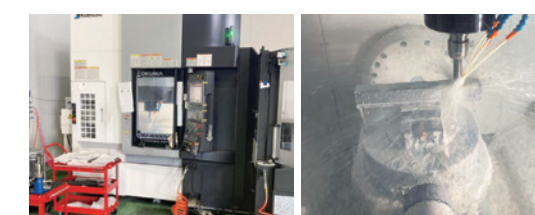
6パレット付き5軸マシニングセンタ。製品精度が向上した

コロナ禍において、自動車業界では特に海外から輸入する部品が途絶え、自動車の生産を行うことができないことが問題となりました。その原因は、部品の生産を安価な海外にて行うためです。そこで、自動車用金型のサプライチェーン毀損リスクに対応するため、従来海外で一部製造していた金型部品を国内で製造する生産体制を整備しました。2022年に、当該生産機能を整備するための新工場を設立し、部品加工に用いる工作機械「6パレット付き5軸マシニングセンタ」及び成形トライに用いるプレス機「1000t機械式プレス」を導入しました。マシニングセンタにより、部品の加工精度の向上(±0.05mmから±0.01mm)および1日あたりの平均部品製作数の増加(2個から6個)の効果が得られました。機械式プレス機により、社内での成形トライが可能となり、従来の客先でのトライ回数の削減(-20%)の効果が得られました。これらの生産性向上の効果から、海外と同等水準のコストにて国内で金型部品の製造が可能となりました。