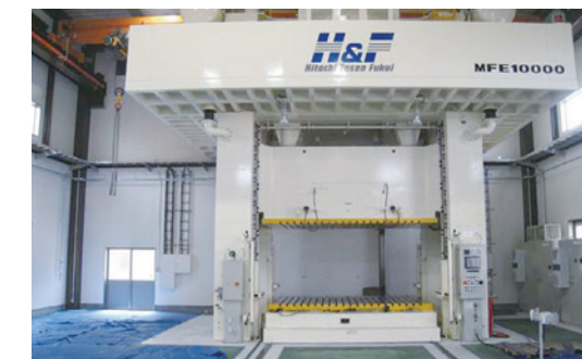
新工場に導入した1000t機械式プレス

当社の方針である「人と機械が協調する」製造プロセスにおいて、特に高度な熟練者の保有する技能のデジタル化(見える化)を行い、人への教育訓練や機械化へ活用したことで生産性向上の効果が得られました。特に、属人性の高さに由来する不具合やミスの防止に効果を発揮し、慢性的に生じていた残業をなくすことに成功しました。