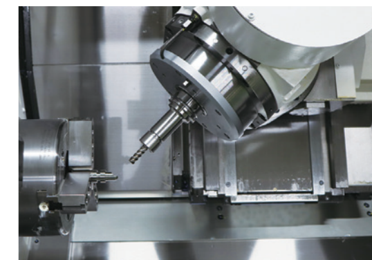
実際の加工の様子

さらにデータベースを活用した切削条件の決定方法は、効率向上だけでなく、電卓の打ち間違いによる誤った条件での加工で発生する事故を未然に防ぐことにも繋がっています。