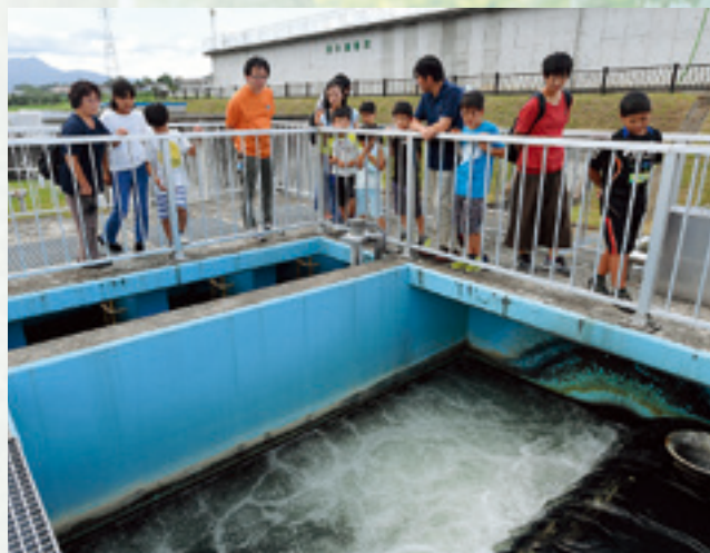
浄水場を見学する様子（県央第二水道事務所）