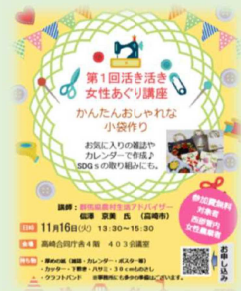
あぐり講座チラシ