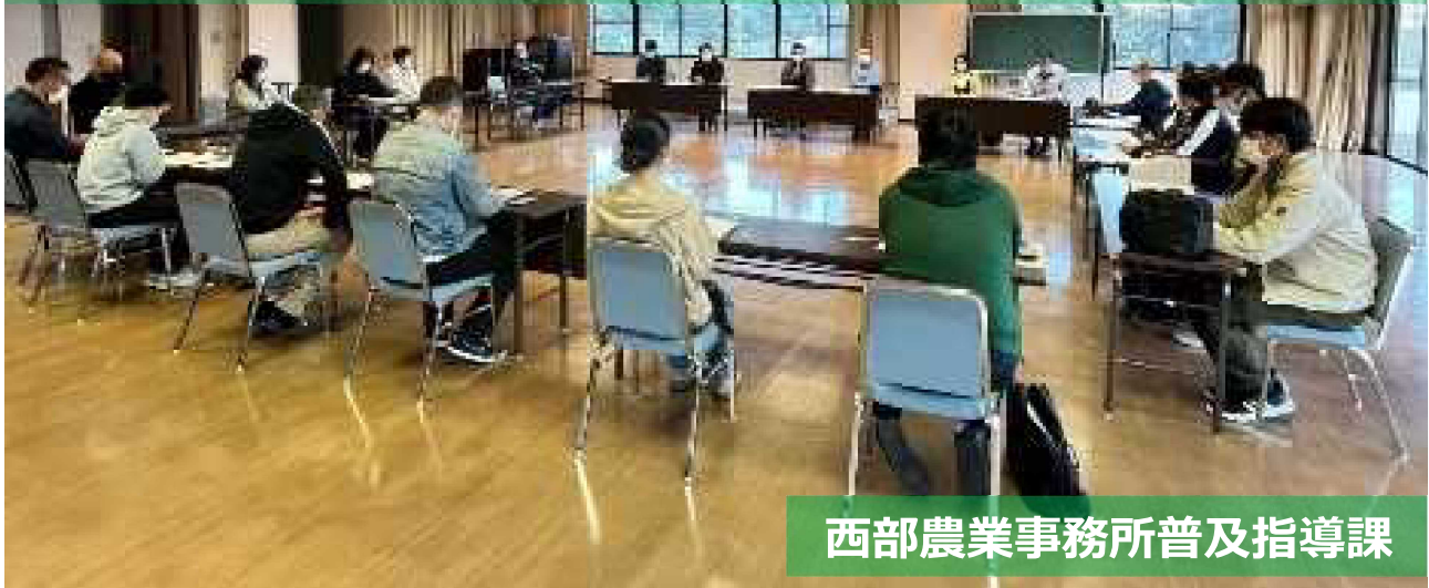
西部農業事務所普及指導課