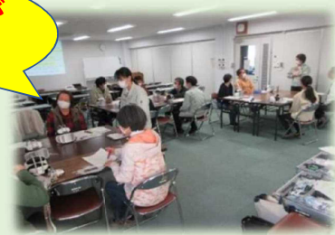
生き生き女性あぐり講座