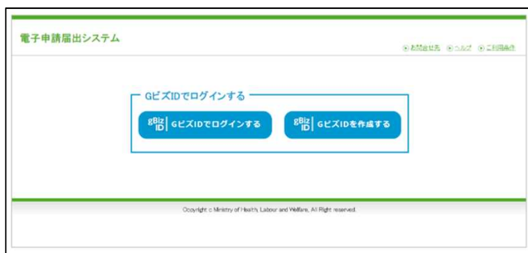
【本システムのログイン画面イメージ】

本システムでご利用できるGビズIDのアカウント種類は、「gBiz IDプライム」と「gBiz IDメンバー」のみになります。