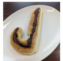
上信道の頭文字「J」をイメージしたパン