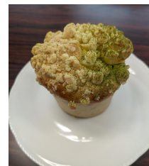
夏と冬の岩櫃山をイメージしたパン

なお、最優秀賞は、開通式典で知事から授与されます。また、試作と実現化は、町内のパン屋さんへ協力頂きました。