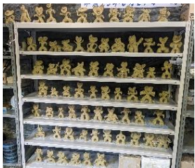
制作されたハート形土偶

開通に先立ち、開通区間の地域の皆様の思い出となるよう、記念イベントとして「ハート形土偶デリネータ」の設置と「上信パン」のお披露目を令和6年3月3日に行いました。