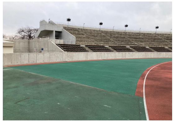
■前橋土木事務所長表彰

社会資本整備総合交付金(社資交/敷島公園) 正田醤油スタジアム群馬アクトフィールド改修工事(分割2号)