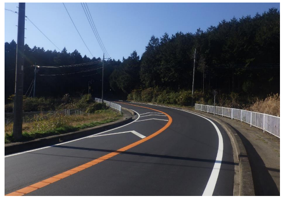
■前橋土木事務所長表彰