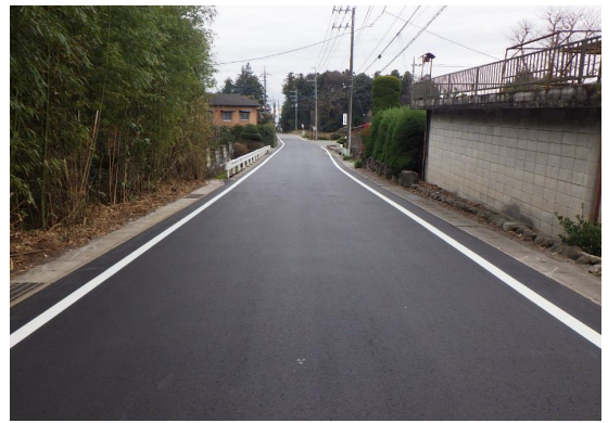
■前橋土木事務所長表彰

社会資本総合整備(防災・安全)(地方道舗装)5カ年加速化 苗ヶ島工区 舗装補修工事