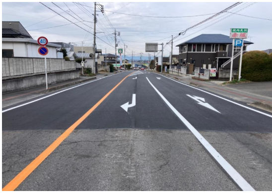
■前橋土木事務所長表彰