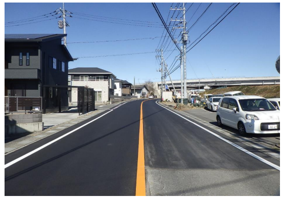
■前橋土木事務所長表彰