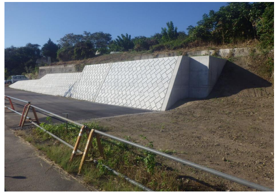
■前橋土木事務所長表彰