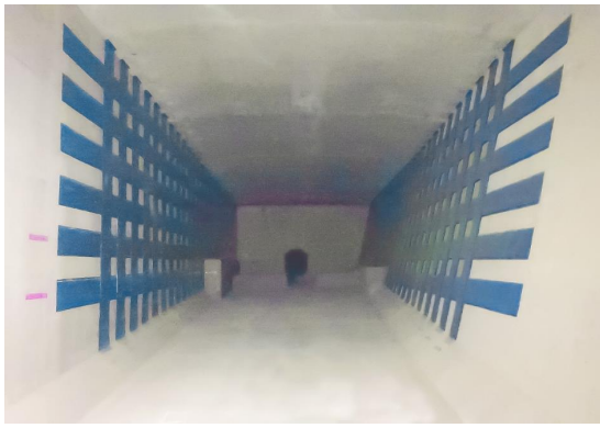
■前橋土木事務所長表彰