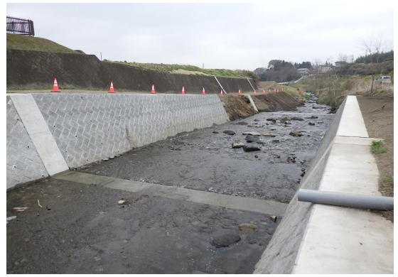
■前橋土木事務所長表彰