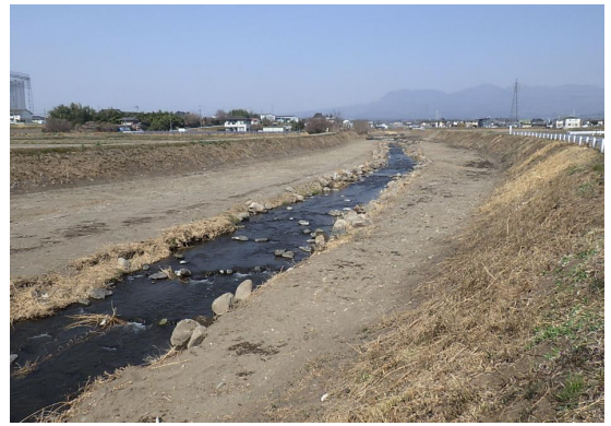
■前橋土木事務所長表彰