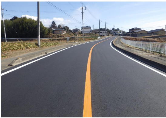
■前橋土木事務所長表彰