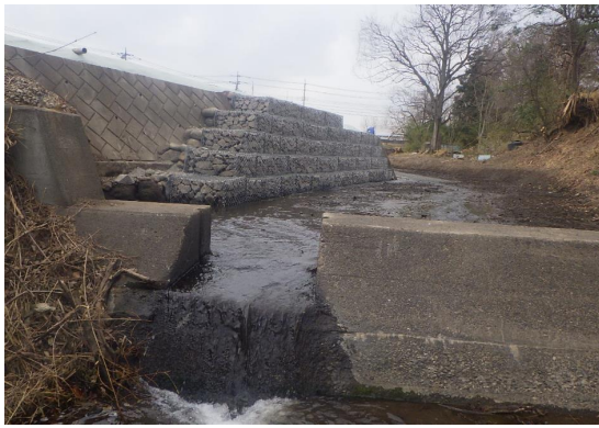
■前橋土木事務所長表彰