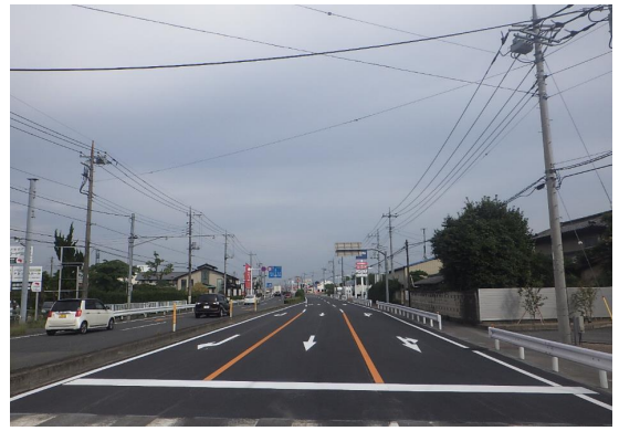
■前橋土木事務所長表彰