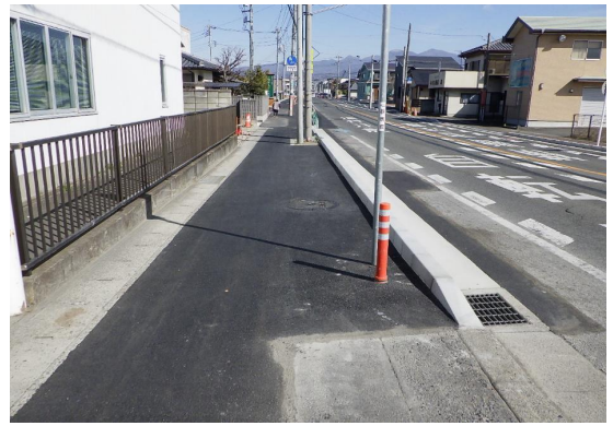
■前橋土木事務所長表彰