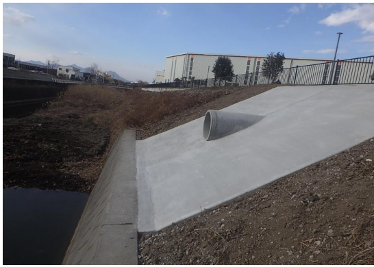
■前橋土木事務所長表彰

社会資本総合整備（国土強靱化・補正）（防災・安全） （5カ年加速化） 2号調整池排水路工事