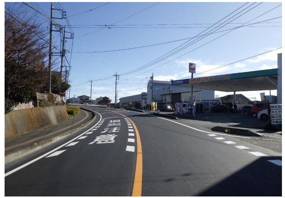
■前橋土木事務所長表彰