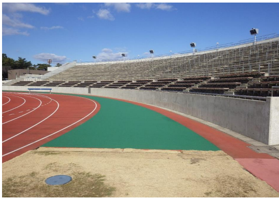
■前橋土木事務所長表彰

社会資本整備総合交付金(社資交/敷島公園) 正田醤油スタジアム群馬アクトフィールド改修工事(分割1号)