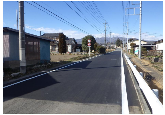
■前橋土木事務所長表彰