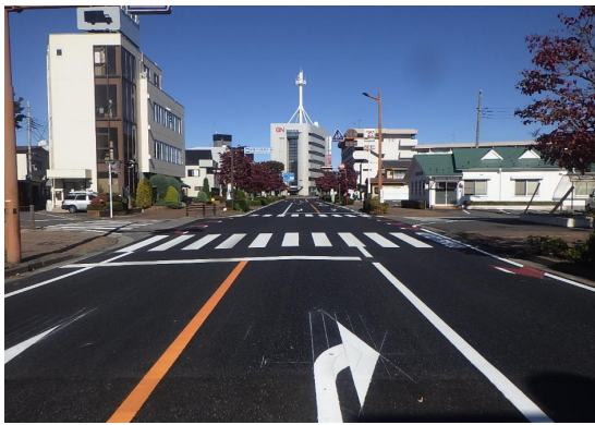
■前橋土木事務所長表彰