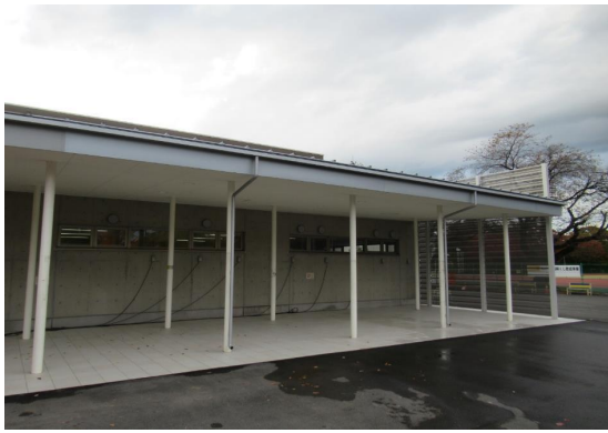
■前橋土木事務所長表彰