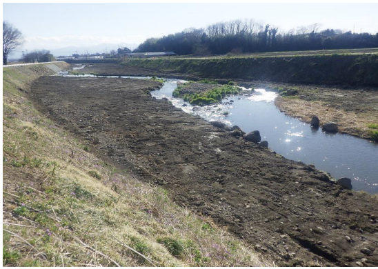
■前橋土木事務所長表彰