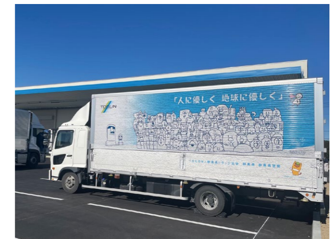
りんたろうさんの絵をのせたデザイントラック

さらに8年前から「繊維原料の国内自給率アップ活動」にも参加し、会社の敷地内でオーガニックコットンの栽培を続けています。