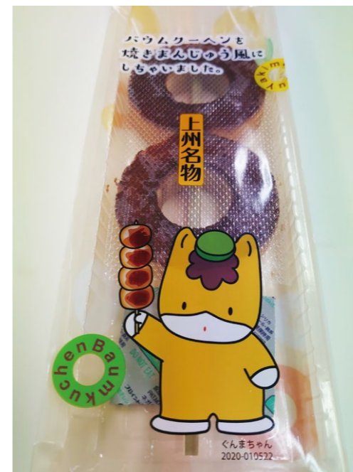
焼きまんじゅう風バウムクーヘンは、県内のファミリーマートと高崎駅「群馬いろは」で販売