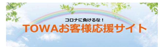
コロナ禍で影響を受けている皆さまを応援するため、取引先が製造する「おいしいもの」や「日用品」等を紹介しています