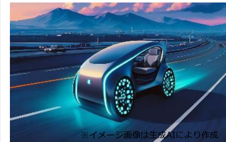
※イメージ画像は生成AIにより作成