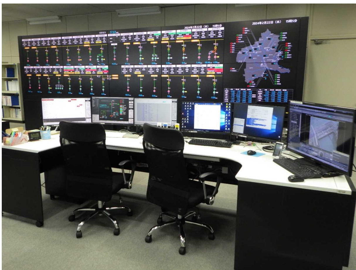
管理総合事務所 更新した遠方監視制御装置