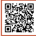
2023年度版中小企業 施策利用ガイドブック