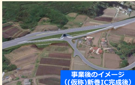
事業後のイメージ (仮称)新巻IC完成後