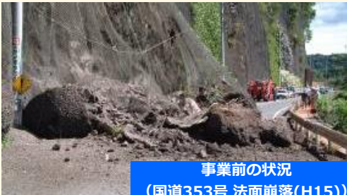
事業前の状況 (国道353号 法面崩落(H15))