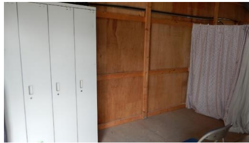
「既存の建物内を利用して、更衣するスペースや着替えの棚を整理した例」