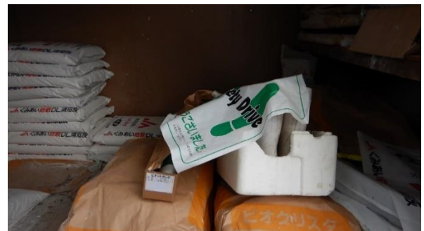
「外来者の着替えと一緒に準備してある農場用フロアマット」