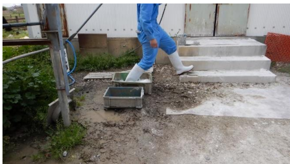
「畜舎前の長靴洗浄用水槽と踏み込み消毒槽」