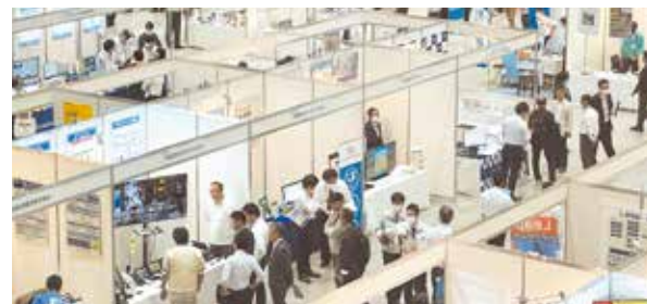
昨年度開催の様子