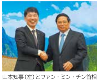
山本知事(左)とファン・ミン・チン首相

これからも、知事自らが各国政府の要人と直接会談する独自のトップ外交を進め、群馬県の取り組みを世界に発信し、新たな飛躍につなげていきたいと考えています。