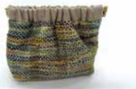
作業製品(絹織物のバネぐち小物入れ)