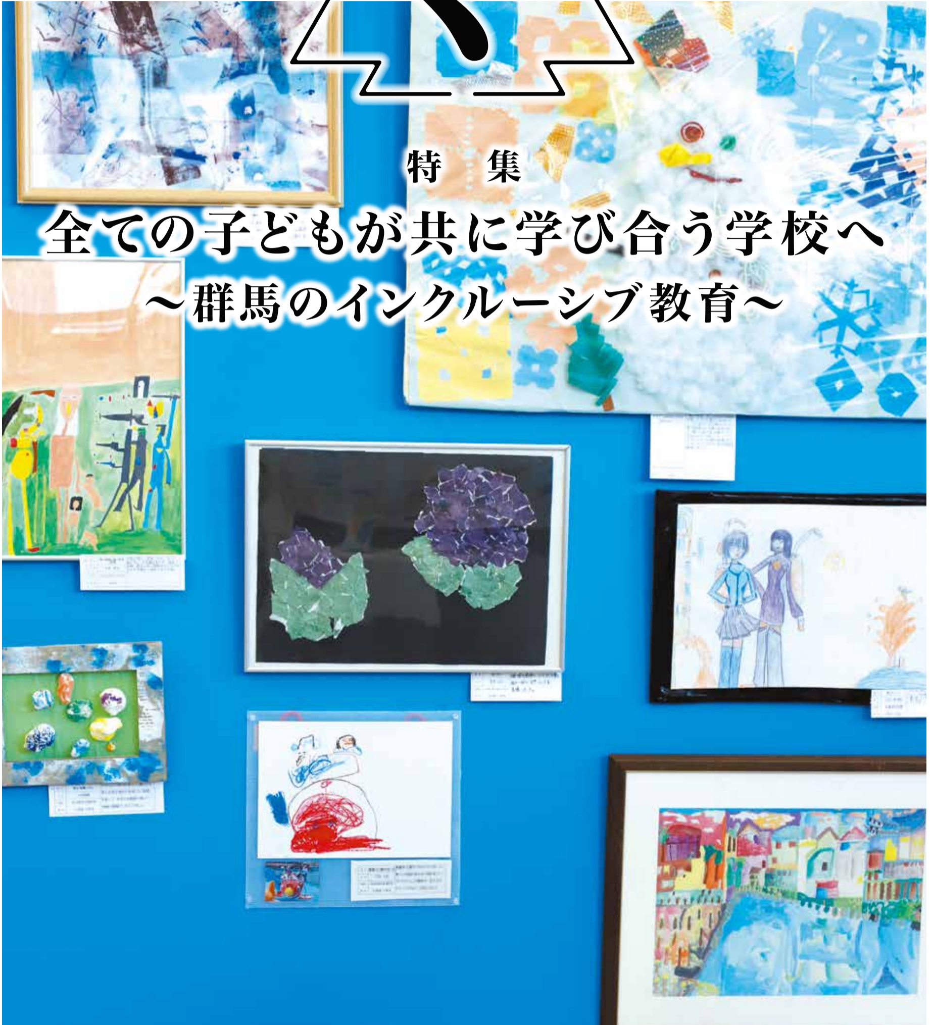
ぐんまインクルーシブフェスタ ニホニホ 2024 「ハートフルアート展」 特別支援学校の児童生徒による作品