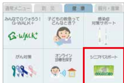
「群馬県デジタル窓口」のメニュー画面