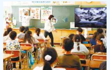
人権週間で、道徳について学ぶ子どもたち

子どもたちが活躍する未来では、自分と異なる他者との関わり合いが求められます。学校はその方法を自然と身に付けることができる場であるべきだと考えます。子どもたちが存分に多様性・寛容性を育てる場所でありたい。そして一人一人が、居心地の良い空間を学校の中に見つけてくれればいいですね。そのような場所になれるよう、挑戦を続けています。