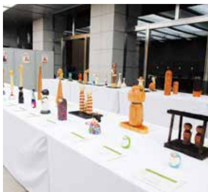
昨年度開催の様子