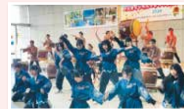
◀県立渡良瀬特別支援学校と桐生市立商業高校による和太鼓×ダンスコラボ「遊駒」

県では昨年12月に、年齢や性別、国籍、障害の有無などにかかわらず、誰もが楽しめるイベント「ぐんまインクルーシブフェスタ2024」を開催しました。特別支援学校の児童生徒による作品展「ハートフルアート展」や高校生と特別支援学校高等部の生徒によるステージパフォーマンス、作業学習で制作した縫製、木工、陶芸などの製品販売があり、多くの人でにぎわいました。