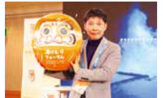
「湯けむりフォーラム2024」会場の山本知事

なお「湯けむりフォーラム」は、リアル開催で3回目となりますが、まだ完成形ではありません。社会に影響のあるフォーラムに成長させ、県民の幸福度向上と、群馬県から日本や世界を変える流れにつなげていきたいと考えています。