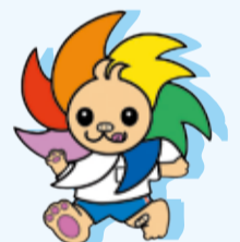
上陽小学校マスコットキャラクター 「じょよよ」 子どもたちによる投票で選ばれたマスコットキャラクター。元気でわんぱくな上陽小っ子をイメージしている