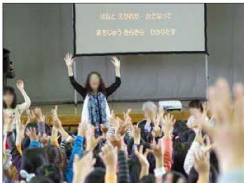
【かおりんと岡ちゃん】