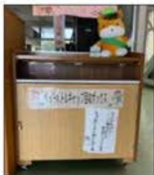
エコキャップ回収箱 (職員室前)