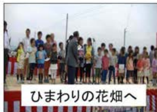
ひまわりの花畑へ