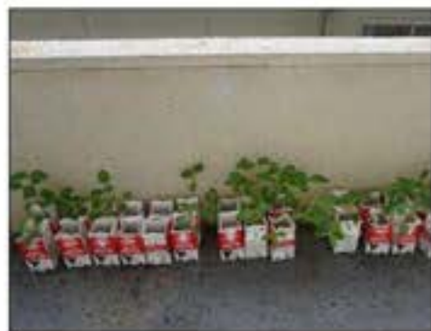
各教室のベランダ