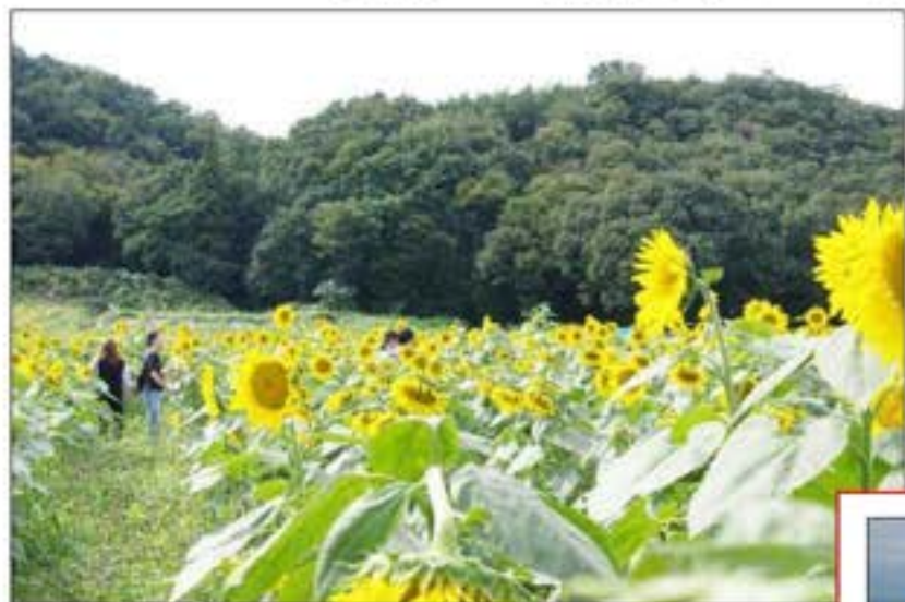
笠懸町吹上地区ひまわり畑