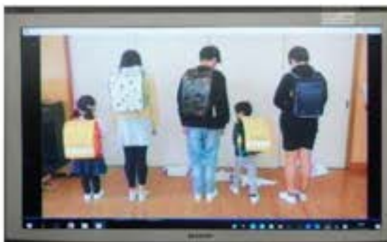
【こんなに大きくなったよ！】