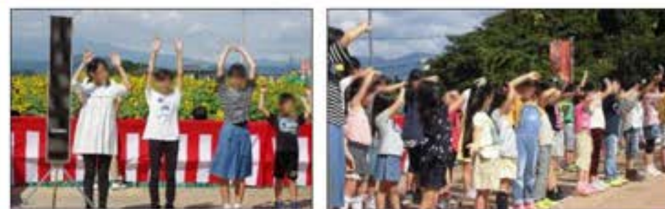
「ひまわりの花畑」を手話と一緒に披露