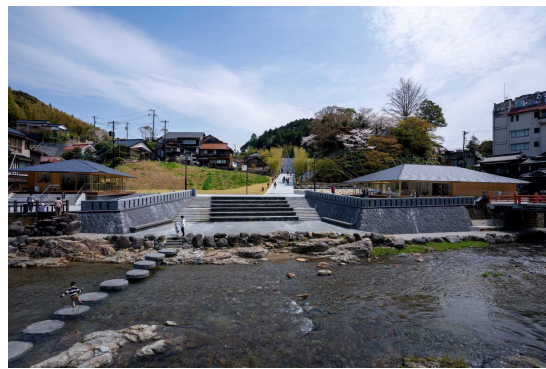
長門湯本温泉 恩湯