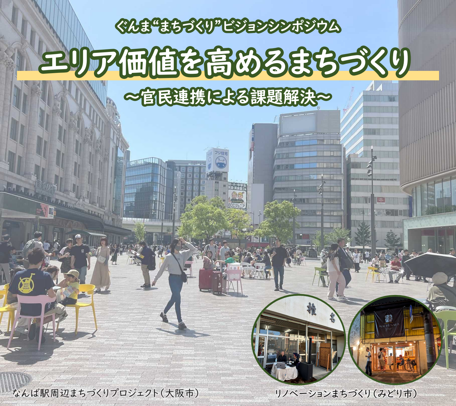
なんば駅周辺まちづくりプロジェクト(大阪市)