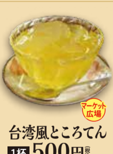
台湾風ところてん 1杯 500円 税込