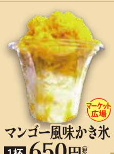
マンゴー風味かき氷 1杯 650円 税込