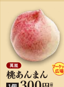
桃あんまん 1個 300円 税込