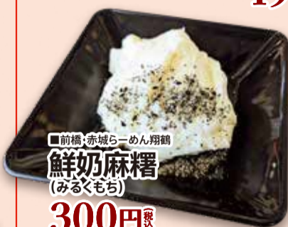
■前橋・赤城らーめん翔鶴 鮮奶麻糬 (みるくもち) 300円 税込