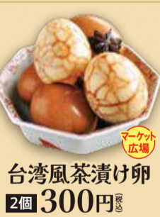
台湾風茶漬け卵 2個 300円 税込