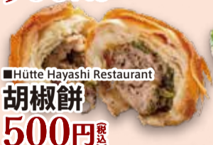
■Hütte Hayashi Restaurant 胡椒餅 500円 税込