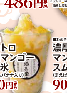
■わめき屋 ふわたロ 南国マンゴー かき氷 (まえばしバナナ入り) 800円 税込