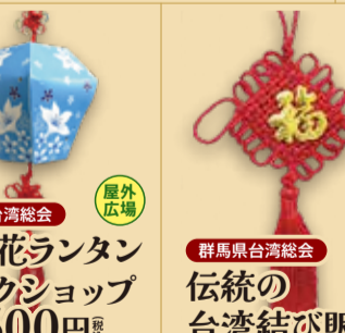
群馬県台湾総会 油桐花ランタン ワークショップ 1回 500円 税込