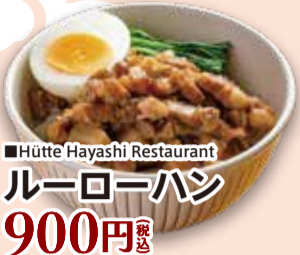
■Hütte Hayashi Restaurant ルーローハン 900円 税込