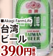
■Akagi FarmLife 台湾 ビール 390円 税込