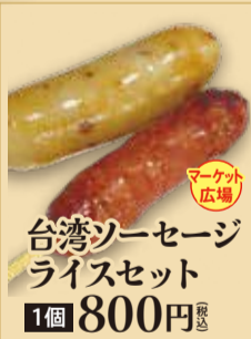
台湾ソーセージ ライスセット 1個 800円 税込