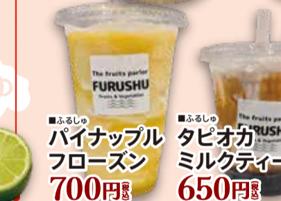
■ふるしゅ パイナップル フローズン 700円 税込