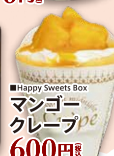
■Happy Sweets Box マンゴー クレープ 600円 税込