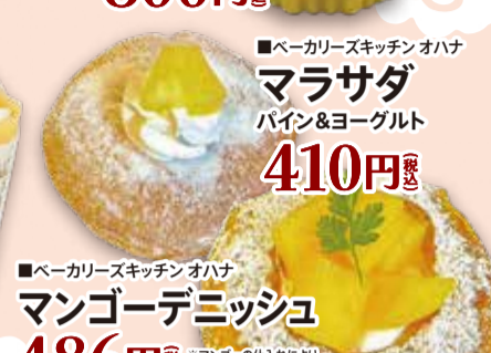
■ベーカリースキッチン オハナ マラサダ パイン&ヨーグルト 410円 税込