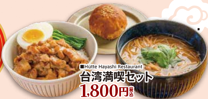
■Hütte Hayashi Restaurant 台湾満喫セット 1,800円 税込