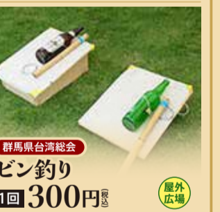
群馬県台湾総会 ビン釣り 1回 300円 税込