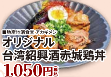
■地産地消費 アカギメン オリジナル 台湾紹興酒赤城鶏丼 1,050円 税込