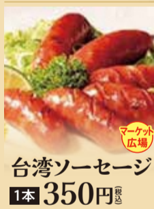
台湾ソーセージ 1本 350円 税込