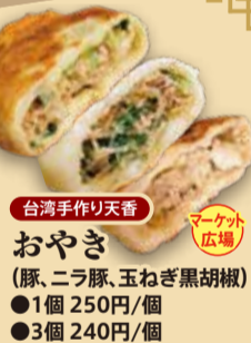
台湾手作り天香 おやき (豚、ニラ豚、玉ねぎ黒胡椒) ●1個 250円/個 ●3個 240円/個