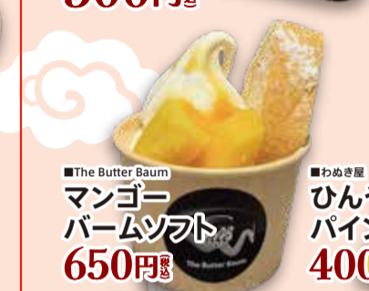
■The Butter Baum マンゴー バームソフト 650円 税込