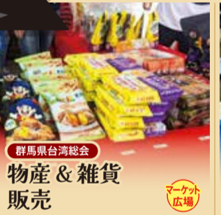
群馬県台湾総会 物産&雑貨 販売