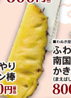
■わめき屋 ひんやり パイン棒 400円 税込