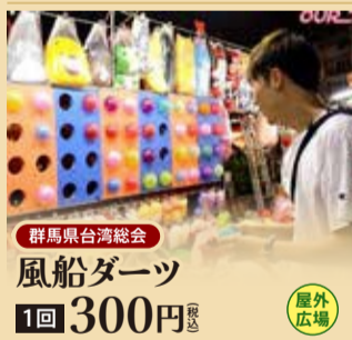
群馬県台湾総会 風船ダーツ 1回 300円 税込