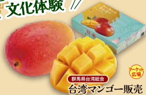
群馬県台湾総会 台湾マンゴー販売