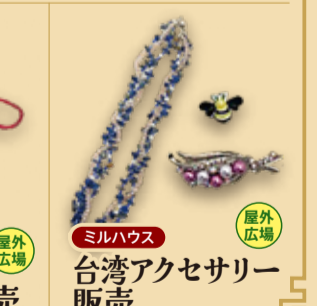
群馬県台湾総会 伝統の 台湾結び販売