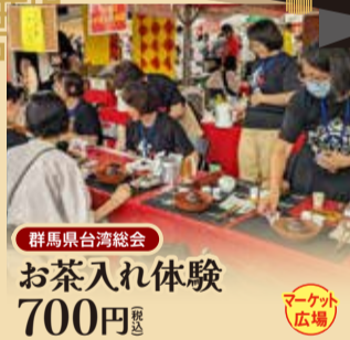
群馬県台湾総会 お茶入れ体験 700円 税込