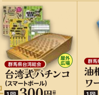
群馬県台湾総会 台湾式パチンコ (スマートボール) 1回 300円 税込