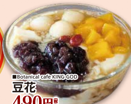
■Botanical cafe KING-GOD 豆花 490円 税込