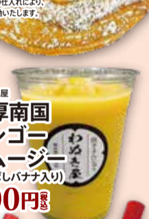
■わめき屋 濃厚南国 マンゴー スムージー (まえばしバナナ入り) 900円 税込