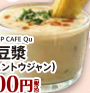
■SHOP CAFE Qu 鹹豆漿 (シエントウジャン) 500円 税込