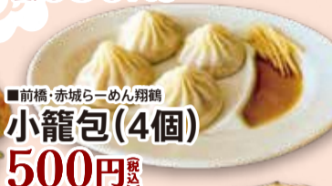
■前橋・赤城らーめん翔鶴 小籠包(4個) 500円 税込