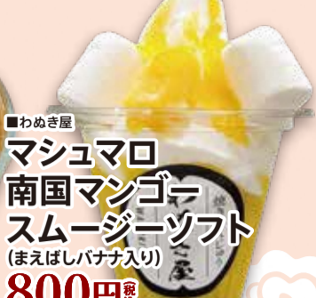
■わめき屋 マシュマロ 南国マンゴー スムージーソフト (まえばしバナナ入り) 800円 税込