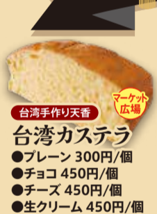
台湾手作り天香 台湾カステラ ●プレーン 300円/個 ●チョコ 450円/個 ●チーズ 450円/個 ●生クリーム 450円/個