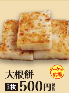
大根餅 3枚 500円 税込