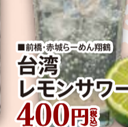
■前橋・赤城らーめん翔鶴 台湾 レモンサワー 400円 税込