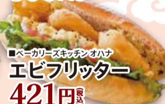
■ベーカリースキッチン オハナ エビフリッター 421円 税込