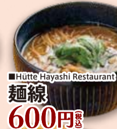
■Hütte Hayashi Restaurant 麵線 600円 税込