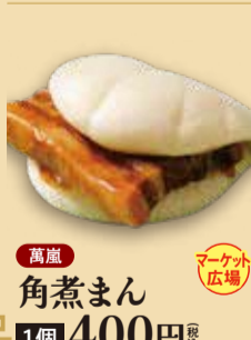
角煮まん 1個 400円 税込