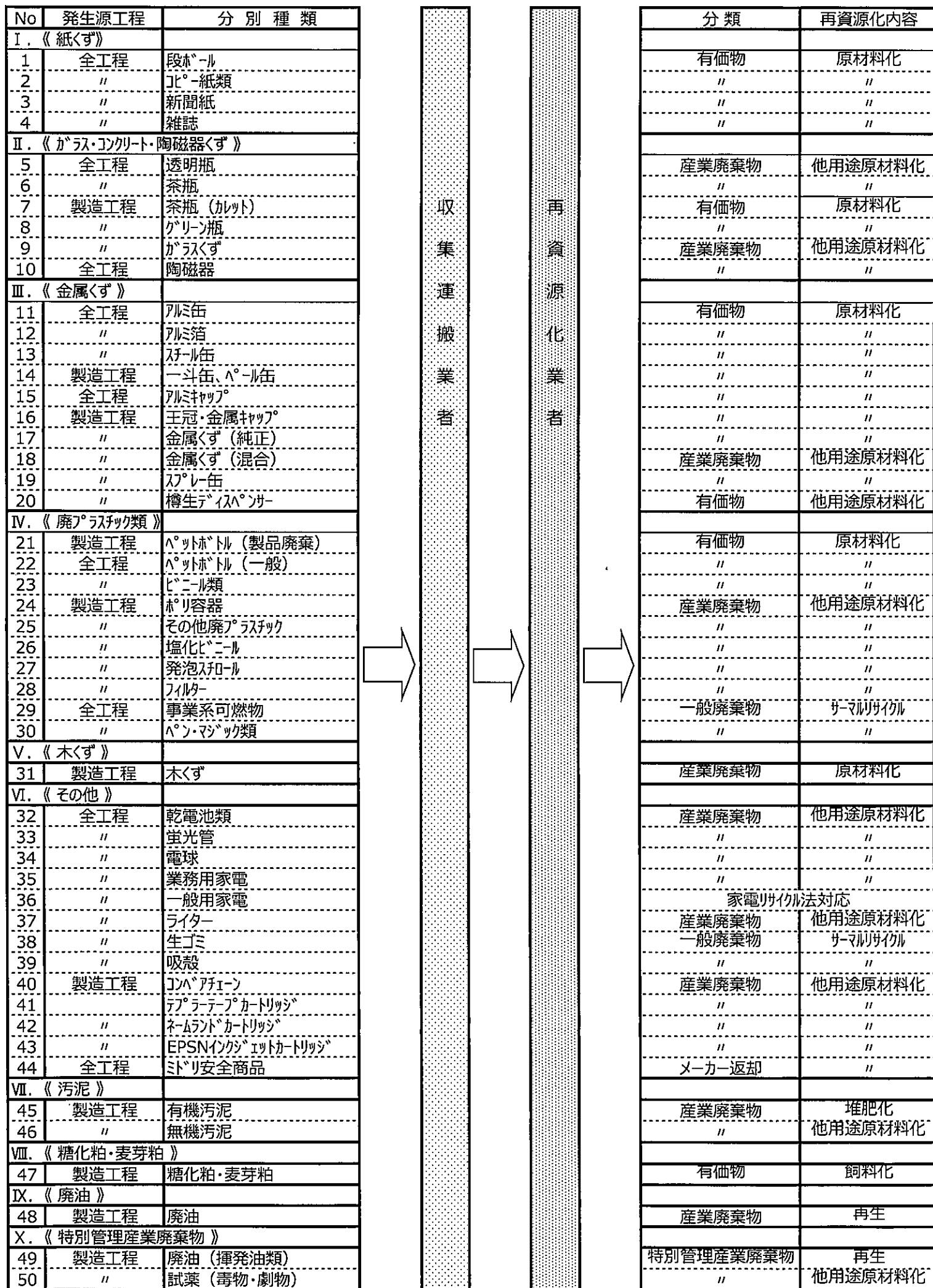
(図1) 廃棄物処理フローシート