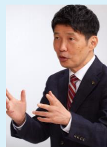
群馬県知事 山本一太

外国人材を雇用し、彼らを「仲間」として迎え入れ、ともに活力を創り出すための 特に優れた取組を行っているとして認証された事業者