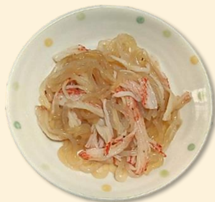
しらたきサラダ(調理例)