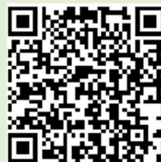
申込画面二次元コード

二次元コードを読み取れない場合は、群馬県ホームページ ( https://www.pref.gunma.jp/page/189638.html ) から申込画面を開いてください。