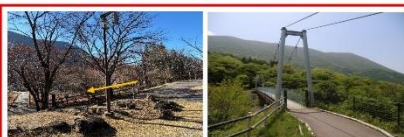
さくらの広場 ふれあい橋

路面凍結の為、こちら側(正門)から入園する事はできません！さくらの広場のふれあい橋から徒歩で入園してください。