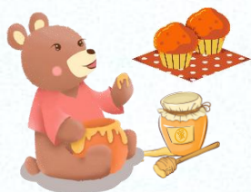
はちみつ・マフィン