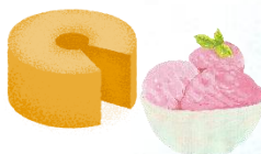
焼き菓子 ジェラート