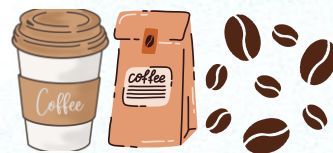
珈琲豆・焼き菓子