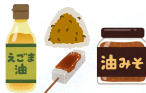
えごま油・味噌 干し芋