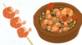
エビ・海鮮加工品