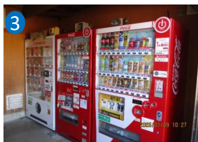
③水と花の広場西側（入口右側） (写真中央が 3-2 手前が 3-4 奥が 3-6)