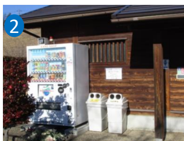
②森のスボレク広場西側 (2-1)