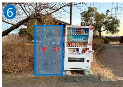
⑥第1駐車場トイレ西側 写真右 (6-1) 左 (6-2)