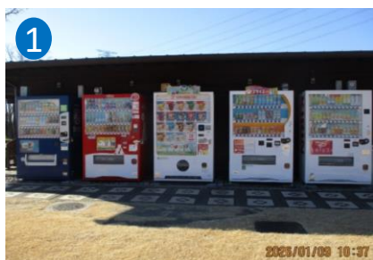
①交流室東側 (写真左から順に 1-1～1-5)

※物件番号の枝番は写真にある自動販売機の左から番号とし、その箇所に設置すること。