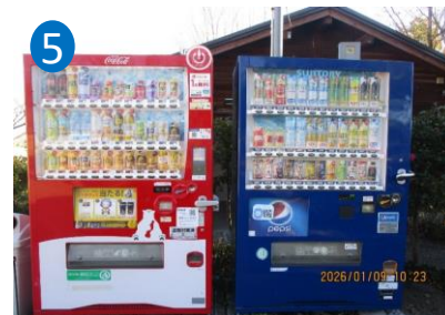
⑤バーベキュー広場トイレ西側 (写真左から順に 5-1、5-2)