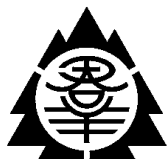
県 紋 章