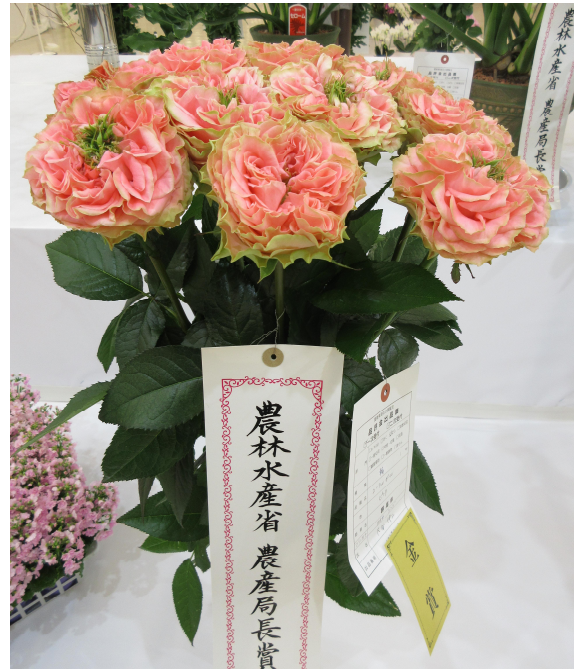
農林水産省農産局長賞 ばら部門 コーラルガール 大谷 伸二 (前橋市)