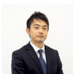
グローバルマーケティング株式会社 シニアコンサルタント

経営計画策定や人事評価制度策定といった上流から、営業研修や生成AI活用といった実行支援まで、幅広い領域の支援を得意としている。