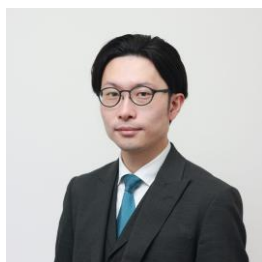
グローバルマーケティング株式会社 コンサルティング部長