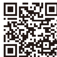
「ぐんま電子申請受付システム」

なお、この申請によって車検証の記載事項を変更することはできませんので、速やかに運輸支局で登録変更の手続きを行っていただくようお願いいたします。