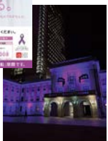
県庁舎ライトアップ