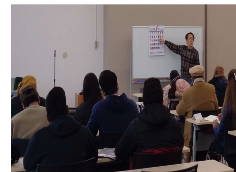
太田市日本語教室の様子