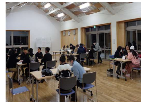
婦恋村日本語教室の様子