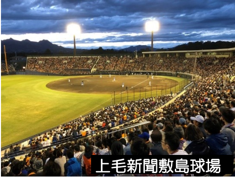
上毛新聞敷島球場

プロ選手と同じ施設でスポーツができ、迫力ある映像を放映できる施設へと改修したことにより、県民の競技力向上への意識が高まります。