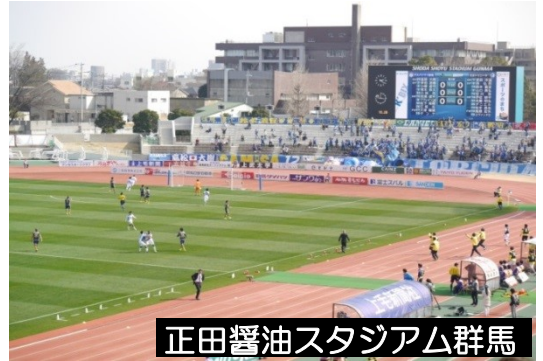
正田醤油スタジアム群馬