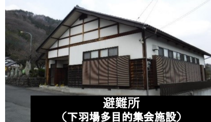
避難所 (下羽場多目的集会施設)