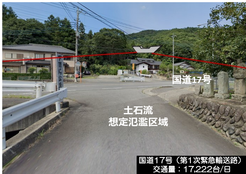
国道17号（第1次緊急輸送路） 交通量：17,222台/日

谷や山の斜面から崩れた土や石が、大雨による出水と一緒に、一気に流れ出る「土石流」から、人命や家などの財産、避難施設、道路、を守ります。