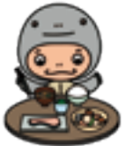
元気県ぐんま マスコットキャラクター GENKI (げんき)