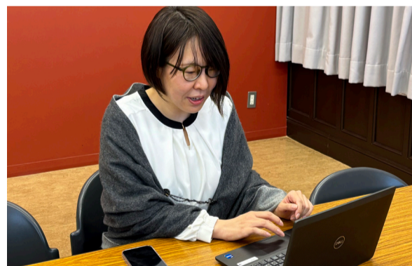
講座を通してさらなる仕事のスキルアップを図っている。

後期の「デジタル仕事術&チームワーク改善講座」はまだ受講中ですが、こちらでも新たな発見があることを期待しています。