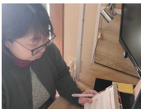
家庭のすき間時間で勉強して資格取得に挑戦。

そのためにも、今後は意識的に幅広い案件に取り組み、経験を積んでいきたいと考えています。知識面では、ITサポートの取得に向けても勉強中です。仕事と家庭を両立する中での勉強時間の確保は簡単ではありませんが、在宅勤務で通勤時間が掛からない分、時間を有効に使って合格できればと思います。