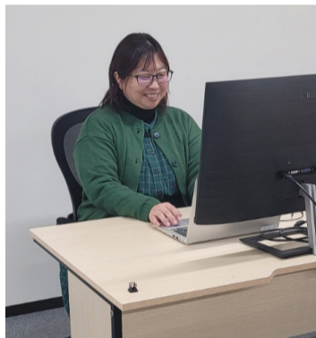
週1回、高崎拠点で仕事を行う。