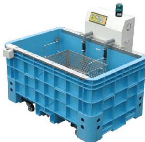
(写真2 温湯消毒機器例)