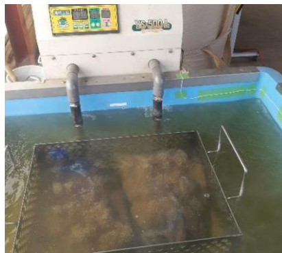
(写真1 温湯消毒実施時の様子)