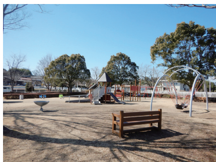
エルシと複合遊具とヤドカリ

デザイン面でも周辺の景観に配慮し、九十九川による緑豊かな景観を活かせるように、周辺環境にもなじむデザイン・色彩を採用しています。