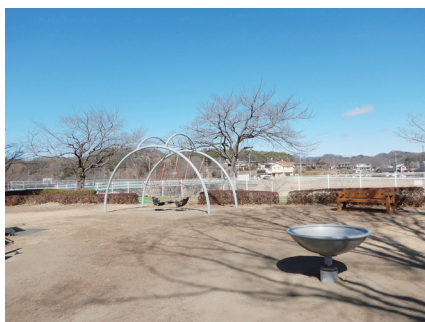
エルシとヤドカリ