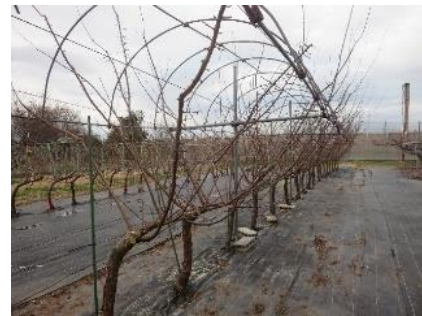
図3 「ゆみまる」ジョイントV字仕立て