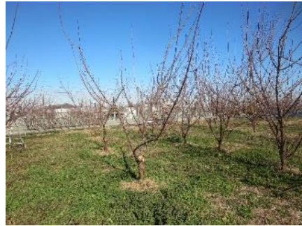
図2 「ゆみまる」開心自然形