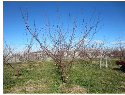
図1 「ゆみまる」主幹形

10aあたりの収穫量は、開心自然形402kg、主幹形372kg、ジョイントV字仕立て969kgであった。階級比率において市場価格の高い3L、2L以上の割合は開心自然形27.5%、主幹形21.3%、ジョイントV字仕立て20.3%であった(表2)。キズ果を除いた収量を算出すると開心自然形313kg、主幹形306kg、ジョイントV字仕立て579kgであった。また、10aあたりの収穫時間では、ジョイントV字仕立てが有意に時間を要し、開心自然形の2.2倍であった(表3)。10aあたりせん定時間は、ジョイントV字仕立てで有意に時間を要し、開心自然形の5.0倍の時間を要した。主幹形は開心自然形の1.3倍の時間を要した(表4)。はさみの使用回数も主幹形、ジョイントV字仕立てにおいて有意に多くなった(表4)。以上のことからジョイントV字仕立ては10aあたりの収量に優れるが、収穫やせん定時間が多くなったため、栽培性は不良と考えられた。主幹形は、キズ果の割合や10aあたりの収穫時間が少なかった。しかし、開心自然形と比較してkgあたりの収穫時間や、せん定時間に時間を要し、はさみ使用回数も多かった。主幹形とジョイントV字仕立てのはさみ回数が多くなった理由は、「ゆみまる」の特徴である強樹勢により側枝配置が難しく枝が旺盛になったためと考えられる。開心自然系は、2L果以上の比率の高さや作業時間の効率の良かった。そのため、「ゆみまる」のウメ生産樹として収穫やせん定の省力的な樹形は「開心自然形」であると考えられる。