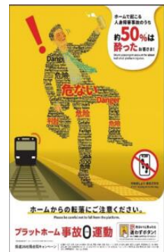
【プラットフォーム事故0運動の周知】