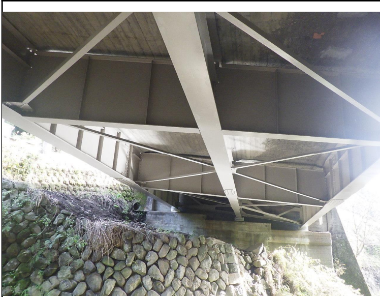
令和5年度 道路メンテナンス事業