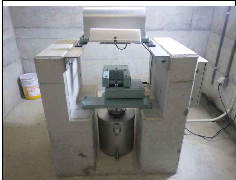
令和5年度 ダムメンテナンス