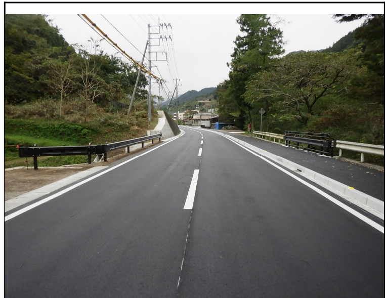
令和5年度 社会資本総合整備