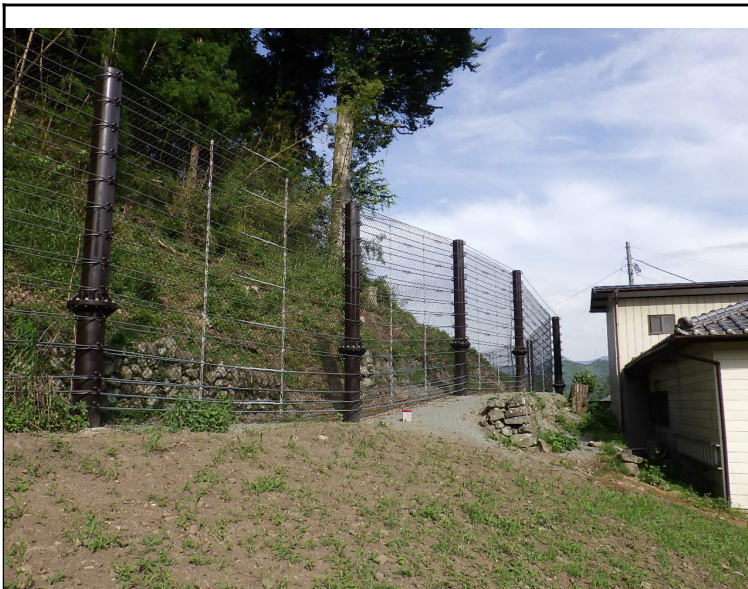
令和5年度 社会資本総合整備