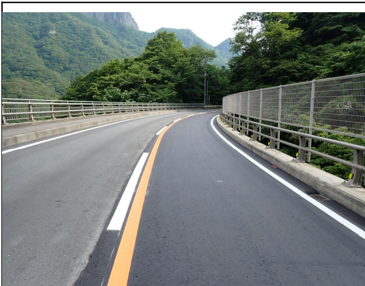
令和5年度 道路メンテナンス事業