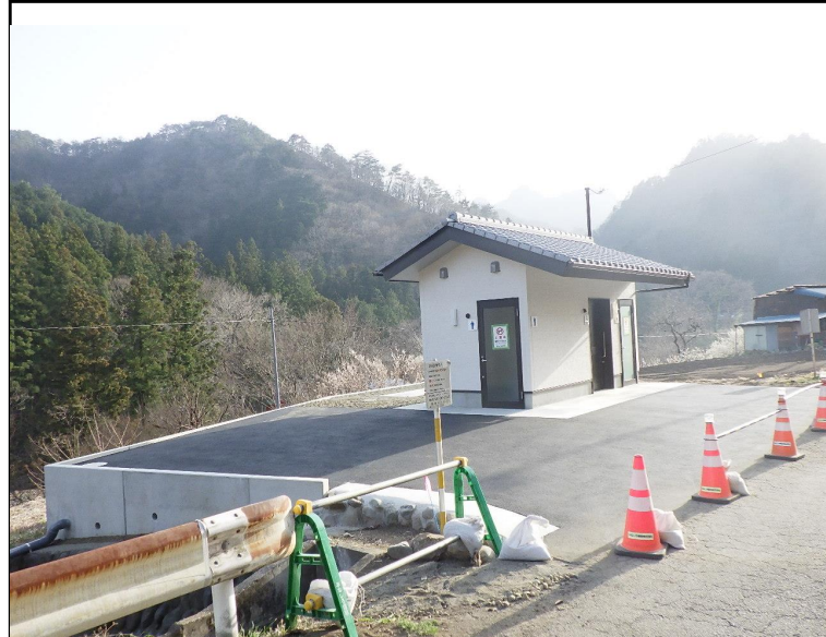
令和6年度 地域公共事業調整費