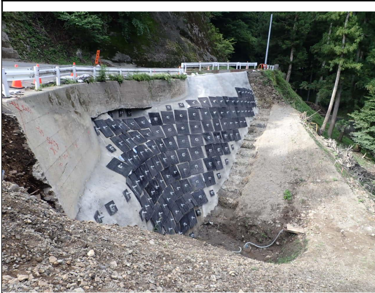
令和5年度 社会資本総合整備