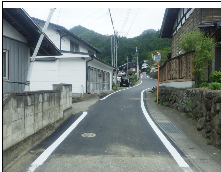
令和5年度 単独道路維持修繕事業