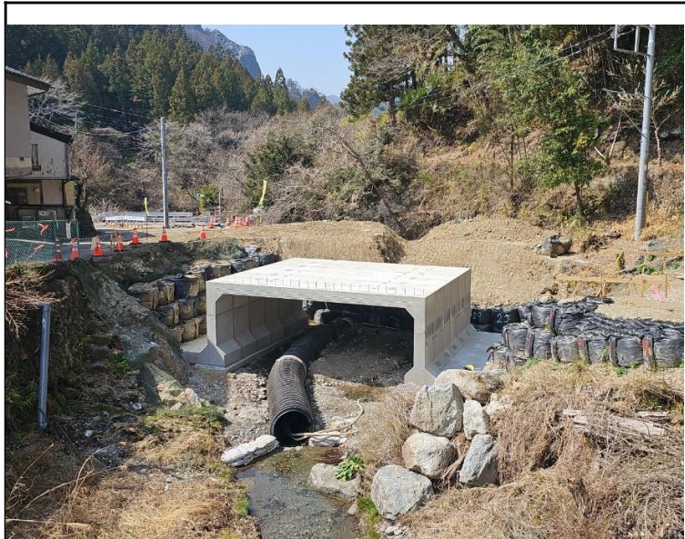
令和6年度 砂防メンテナンス事業