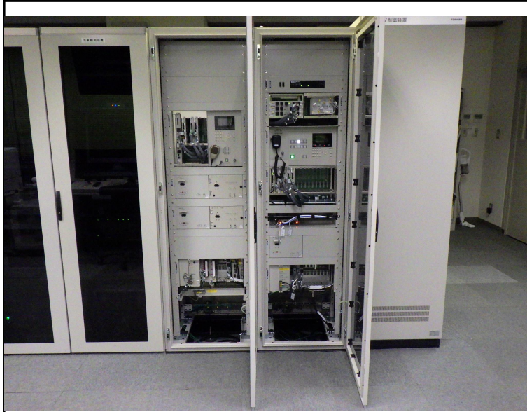
令和5年度 ダムメンテナンス