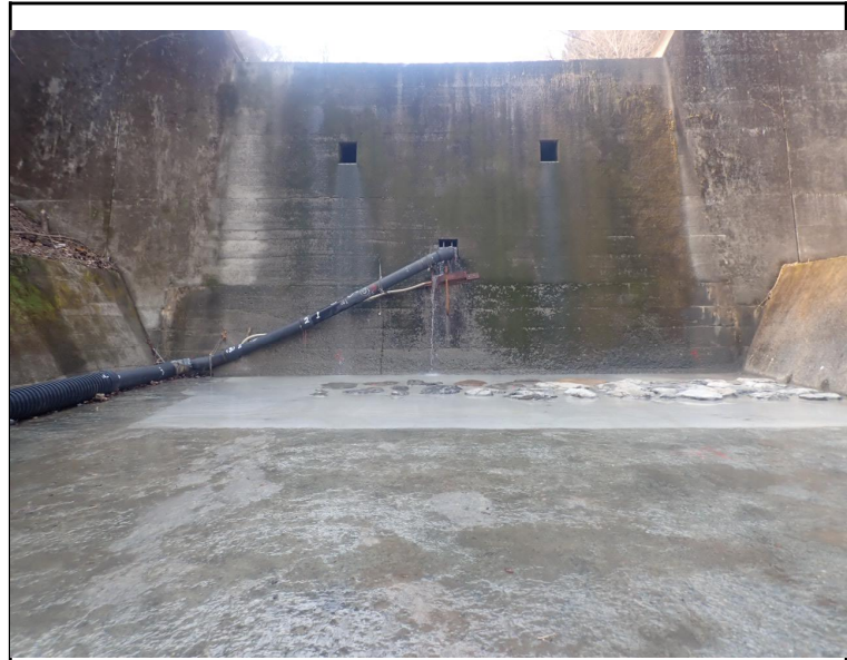
令和6年度 単独砂防維持管理事業