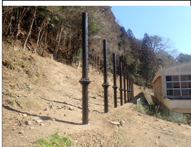
令和6年度 社会資本総合整備