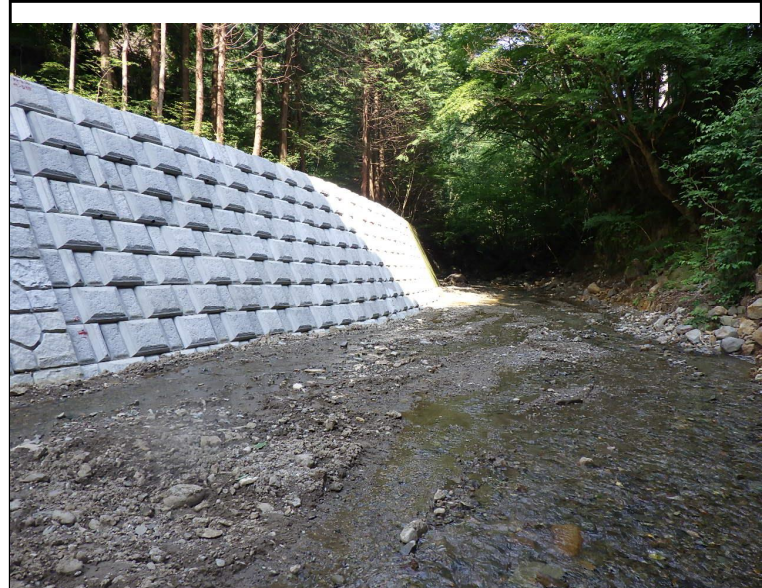
令和5年度 単独砂防維持管理事業