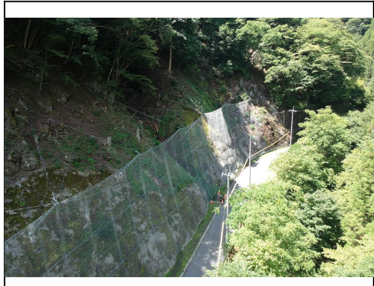
令和5年度 社会資本総合整備