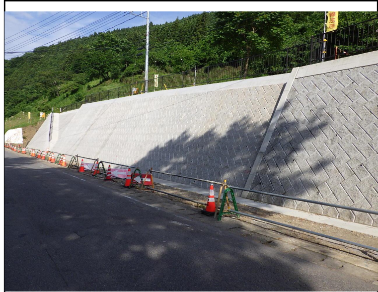
令和5年度 社会資本総合整備