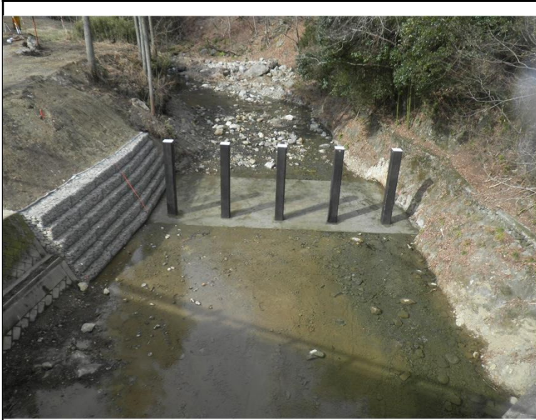
令和6年度 単独砂防施設事業