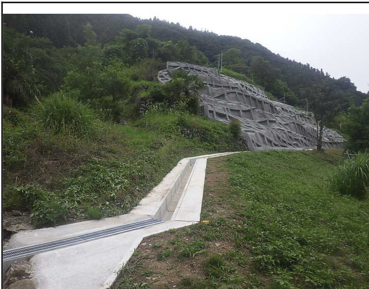
令和5年度 社会資本総合整備