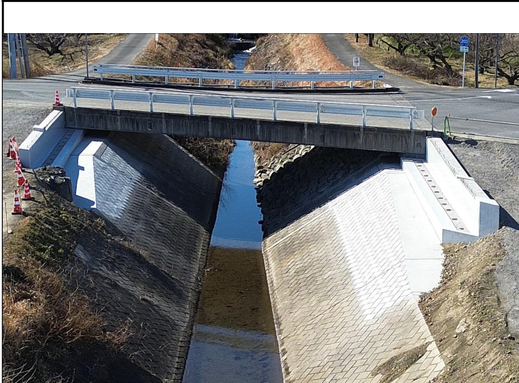
令和5年度 社会資本総合整備