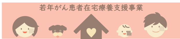
若年がん患者在宅療養支援事業