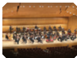
現在の移動音楽教室