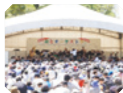
森とオーケストラ

身近なオーケストラとして地域の音楽文化の普及を図るため、群響楽団員が地域の施設に向く「心に響く音楽会」、実際の議場において演奏する「群馬県議会議場演奏」、群馬の森野外ステージで演奏を行う「森とオーケストラ」、群響合唱団との共演、各地の第九合唱団の方々と第九演奏会を行うなどの活動を通して、地域の皆様へ音楽の感動を届けています。