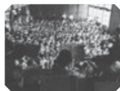
昭和20年代の移動音楽教室

小学校、中学校、高校での音楽教室を行う「移動音楽教室・高校音楽教室」、保育施設等で演奏会を行う「幼児移動音楽教室（びよびよコンサート）」、県内の小・中学生の金管バンド・吹奏楽部の児童生徒に群響楽団員が直接指導する「楽器セミナー」、文化庁の選定した文化芸術団体が、学校の体育館や文化施設でオーケストラ、演劇等の巡回公演を行う「舞台芸術等総合支援事業（学校巡回公演）」などの活動を行っています。