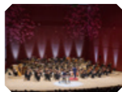
夏休みコンサート

「Meet the オーケストラ!〜多くの方へ オーケストラの扉を〜」をテーマに掲げ、案内人と一緒に大人もお子様もオーケストラを楽しめる「夏休みコンサート」、お子様に人気なゲストと一緒に楽しめる「0歳からのコンサート」、車椅子の方や障がいをお持ちの方もだれでも気軽にご来場いただける「群響ふらっとコンサート」を行っています。いずれの公演も未就学児のご入場が可能です。演奏中の声や離席についてご理解をいただくようご案内しております。