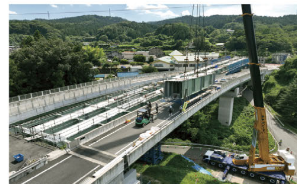
【吾妻東バイパス2期（事業中）】