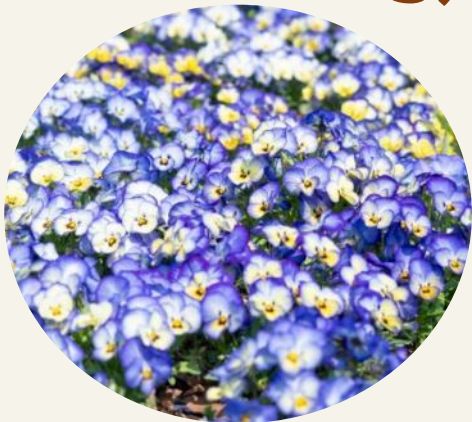
パンジー・ビオラ